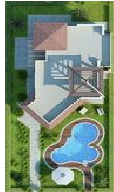
Терраса на крыше