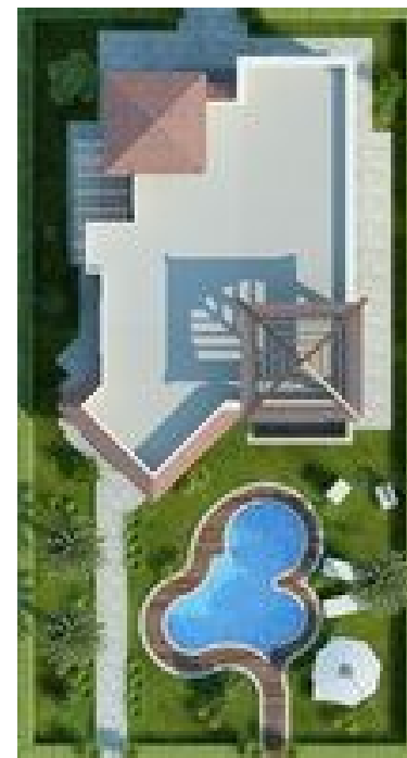
Терраса на крыше