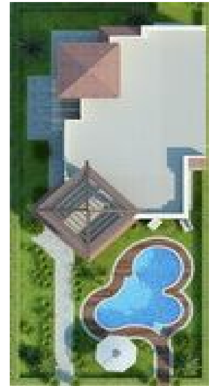
Терраса на крыше